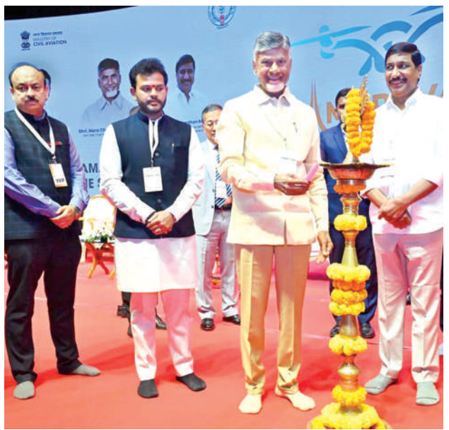
మంగళవారం జ్యోతి ప్రజ్వలనతో డ్రోన్ సమ్మిట్ను ప్రారంభిస్తున్న సీఎం చంద్రబాబు