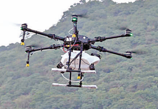
సమ్మిట్ ప్రారంభం సందర్భంగా సీఎం చంద్రబాబు ఆవిష్కరించిన డ్రోన్